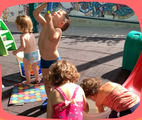
CASALET LLAR D'INFANTS