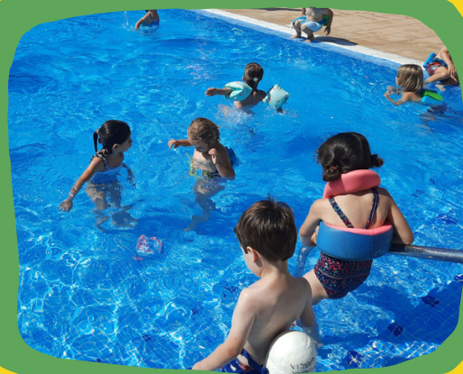
CURSET DE NATACIÓ

Preinscripció en línia del 13 al 17 de maig. Escanegeu el QR o entreu a www.caldesdemalavella.cat