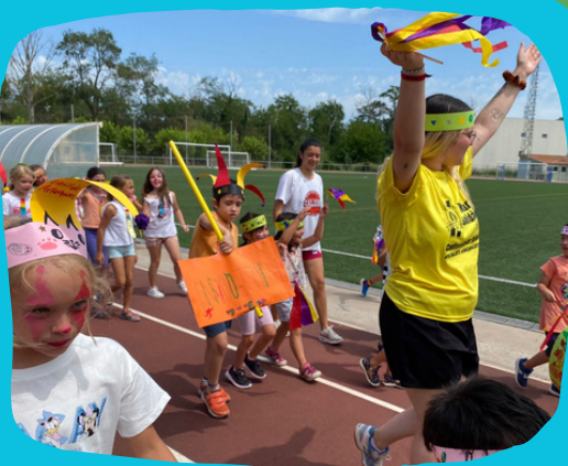
MATINS DE JOCS